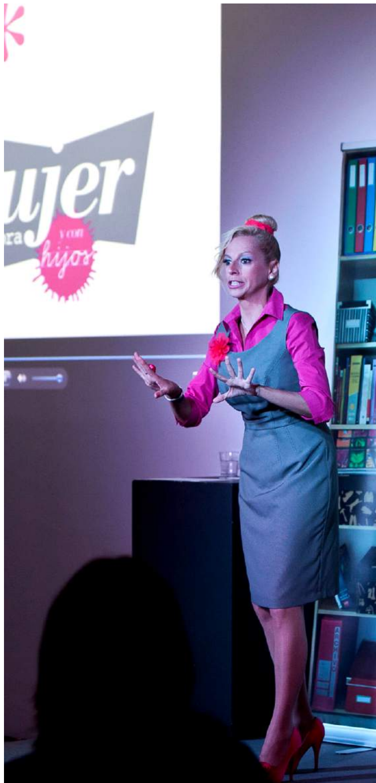
2013 - San Martín C C C, Gran Canaria