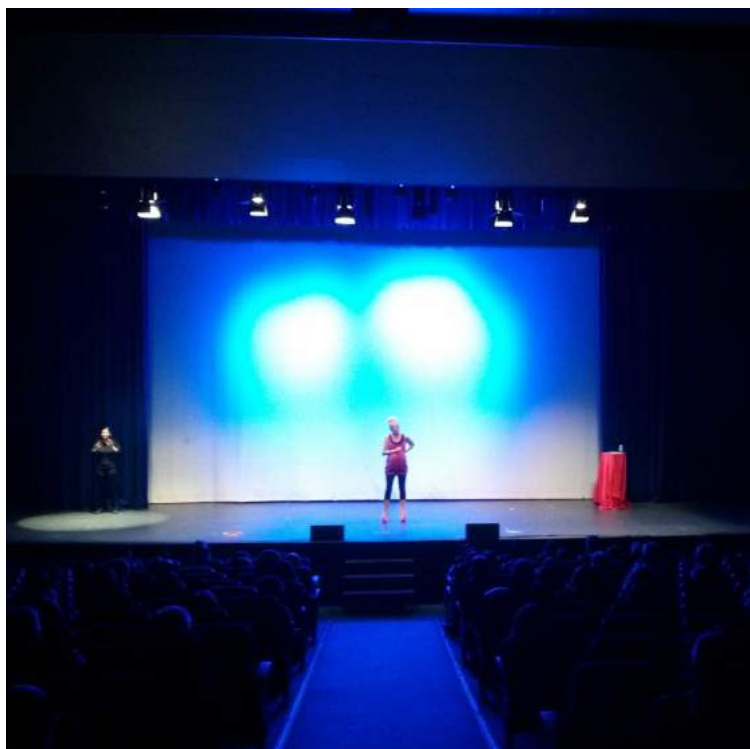
2016 - Auditorio Infanta Isabel, Tenerife