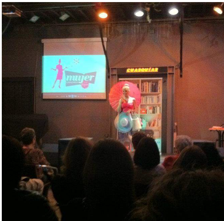
2012 - Sala Cuasquías, Gran Canaria